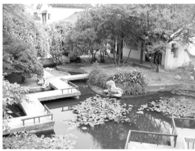
Дворик в кампусе для иностранных преподавателей в СТИ