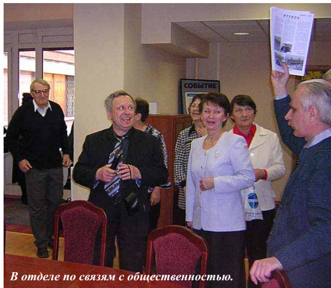
В отделе по связям с общественностью.