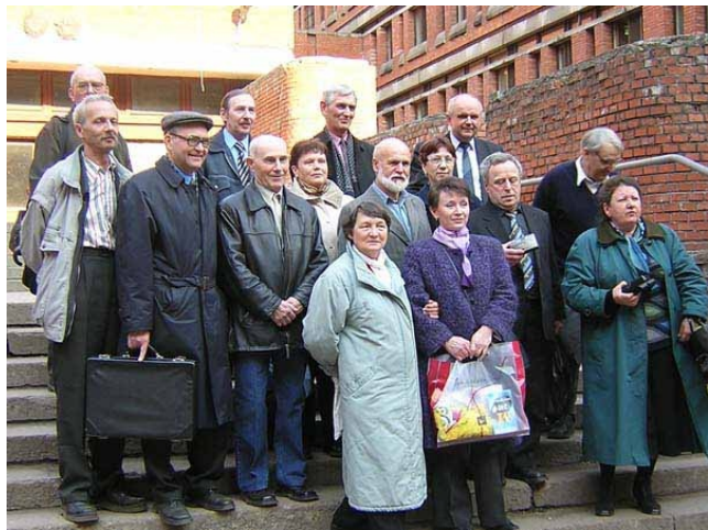
“Айсара-7”, 2005 год.

И все-таки мы собрались. Мы - это Отряд “Айсара-7”, поехавший летом 1965 года строить дома в казахстанской степи. На встречу в ЛЭТИ 40 лет спустя пришли 23 человека. Всего же из 56 бойцов отряда разыскать удалось 31. Кого-то удержали дома семейные трудности и большие расстояния, а кто-то испугался, что разговоры пойдут только о болезнях.